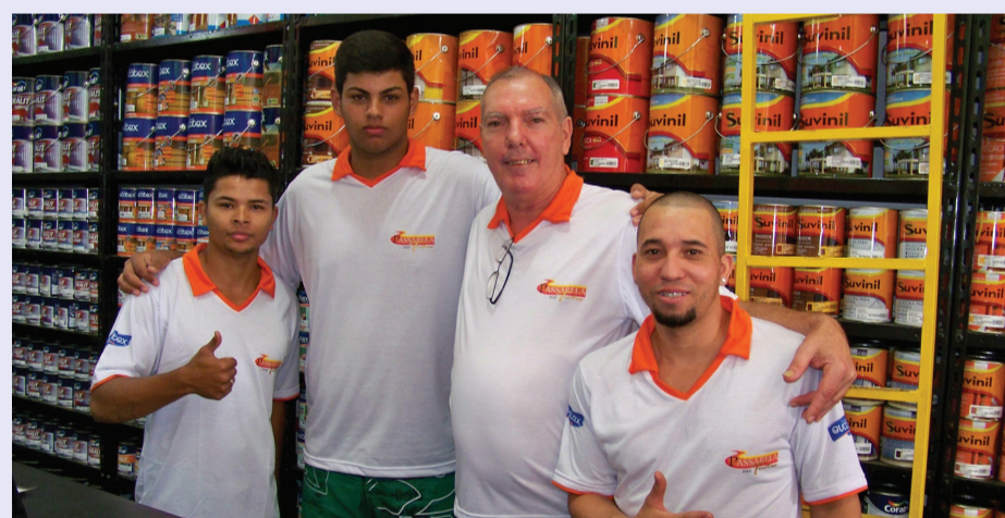
Segunda loja “Passarela das Tintas” foi inaugurada no bairro Belas Artes, no dia 17 de julho

que prestaram muita ajuda para esse evento fosse realizado.